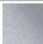
Niva cod 11