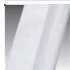
Bianco cod A