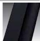
Nero opaco cod H