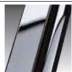
Cromo cod K