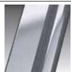
Silver cod B