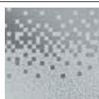
Zephyros 1 cod 68